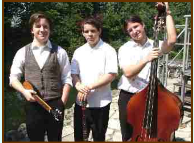
A Patonai zenekar