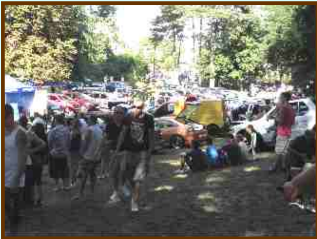
A III. Tuning fesztivál Tápiószelén