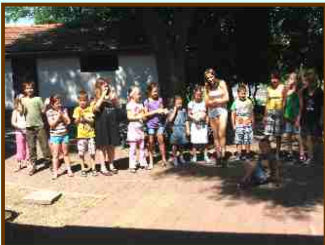
A katolikus nyári tábor résztvevői