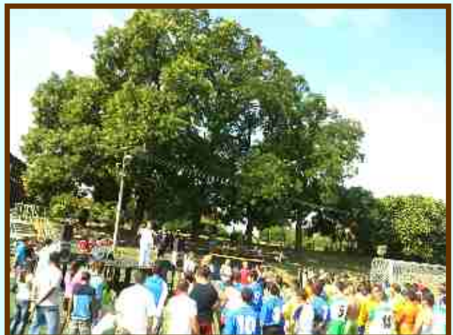
Térségi roma sportnap

Önkormányzati Híradó - Tápiószele Város Önkormányzatának lapja