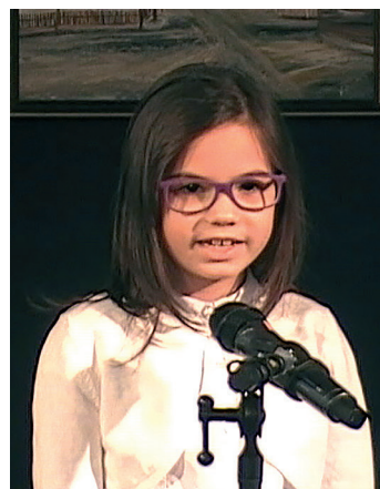
Magyar Kultúra Napja