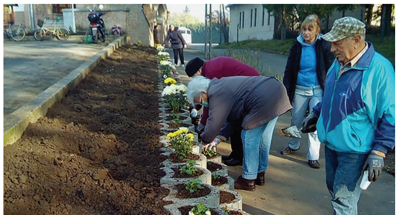
Virágültetés a Bizalom Klub tagjaival