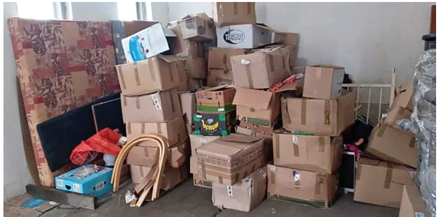
Jónak lenni jó!