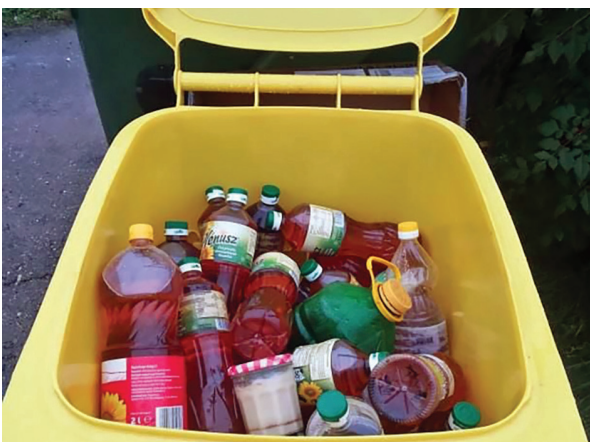
Használt sütőolaj gyűjtése