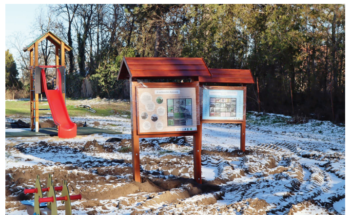
Épül a Kincsem játszó- és élménytér, szabadidőspark