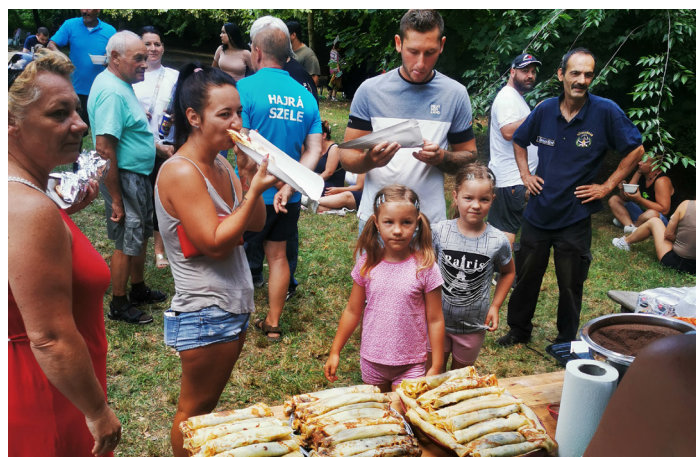
Zafira Klub találkozója a Népkerthben