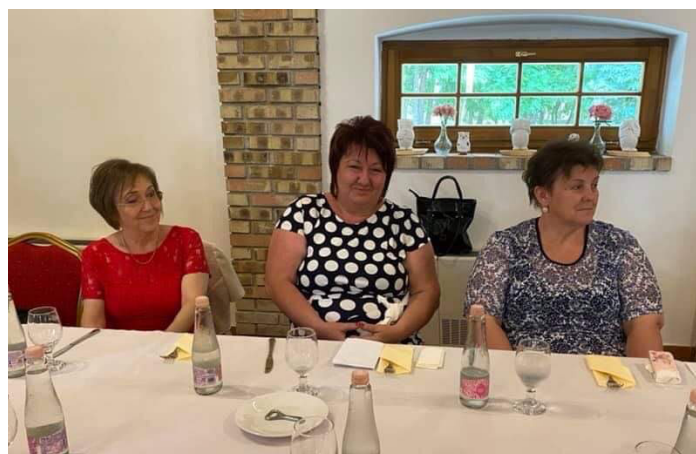
Nyugdíjba vonuló óvodapedagógusok