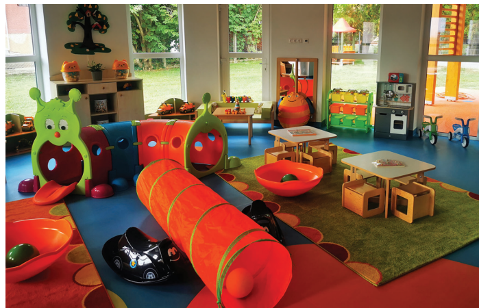
A bölcsőde ünnepélyes átadása