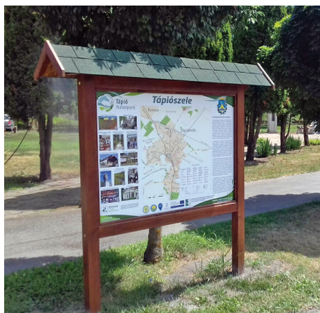
Tápió Natúrpark információstábla