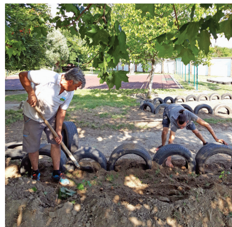
Az iskola udvarának felújítása