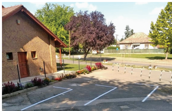
Új parkolóhelyek kialakítása a Farmosi úti temetőnél