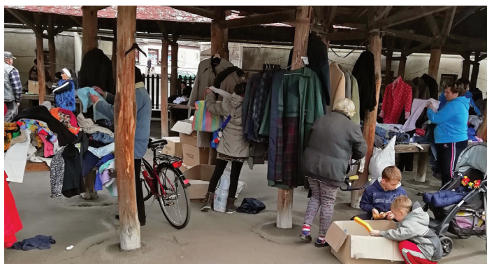
Jónak lenni jó!