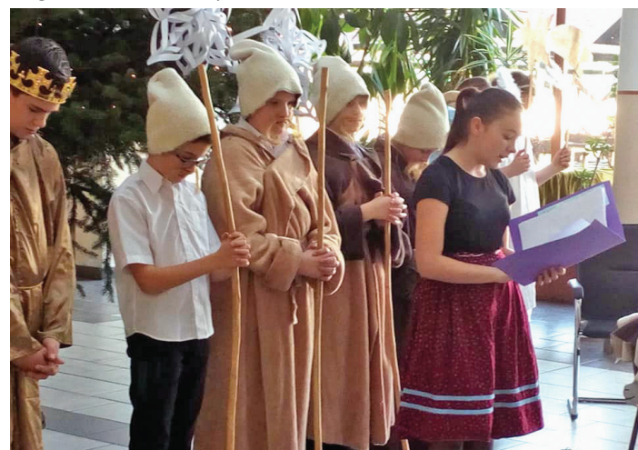
Betlehemes játék az iskolában