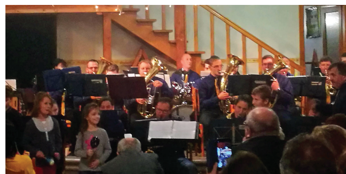
A Nagykátai Fúvószenekear karácsonyi koncertje