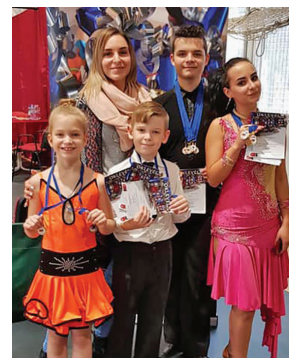
A Duende Tánciskola növendékei