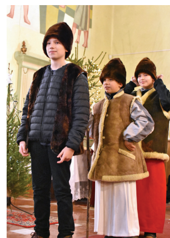
December 24.: „A kis Jézus megszületett, örvendjünk!”