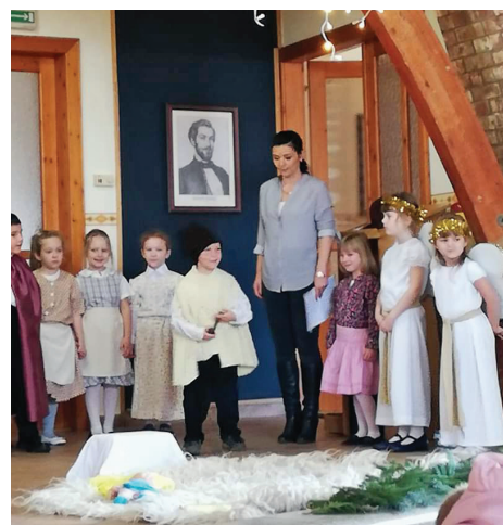
A karácsony igaz meséje