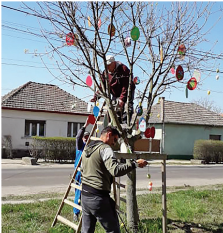
Tojásfa a Kossuth parkban