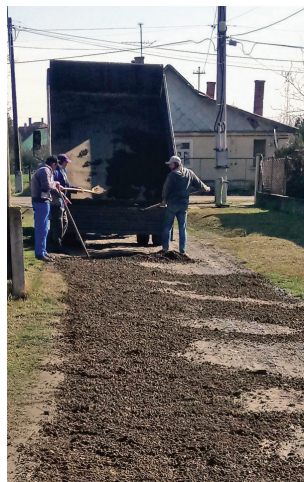
Sziget út javítása