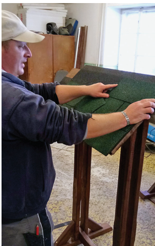
Megújulnak a közterületen lévő kukák