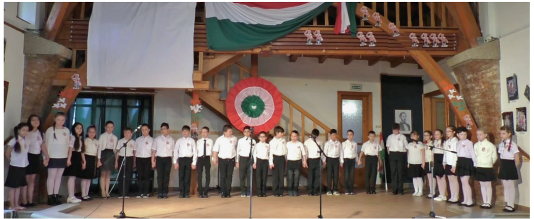
Emlékezés a szabadságharc hőseire