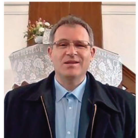
Református gyülekezeti alkalom élő közvetítése