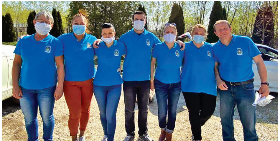
Segélycsomag osztás a Hajrá Szele csapat jóvoltából