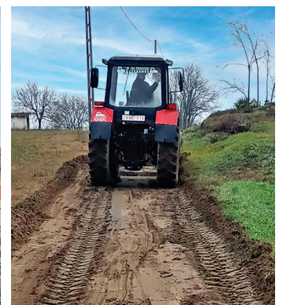
Kisfarmosi út javítása