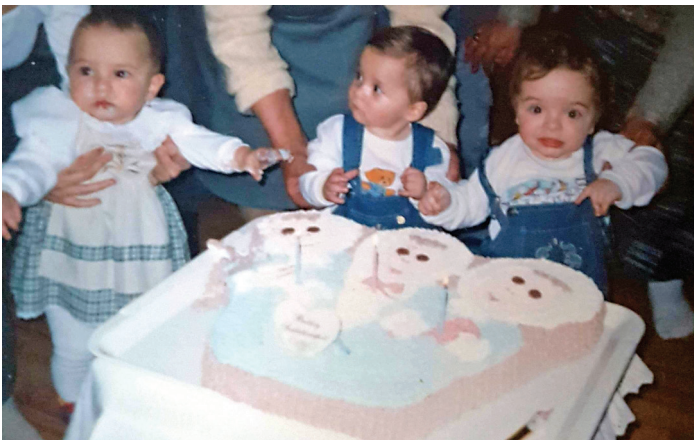
Boldog születésnapot kívánunk!