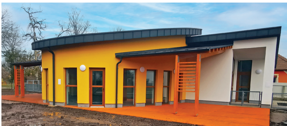
Elkészült a bölcsőde épülete