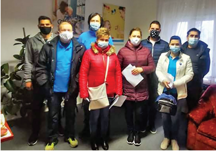
Jónak lenni jó!