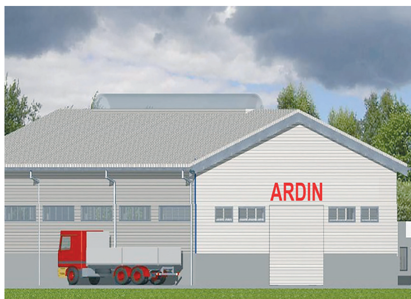
Új, acélszerkezet gyártásával foglalkozó cég létesül a Vásártéren