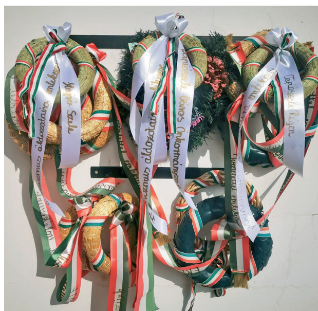
Koszorúzás a kommunizmus áldozataink emléktáblájánál