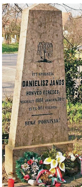
Nagy idők nagy tanúi